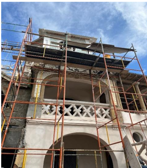
Fachada central. Autoria: Eduardo Santos Data: 26/03/2026