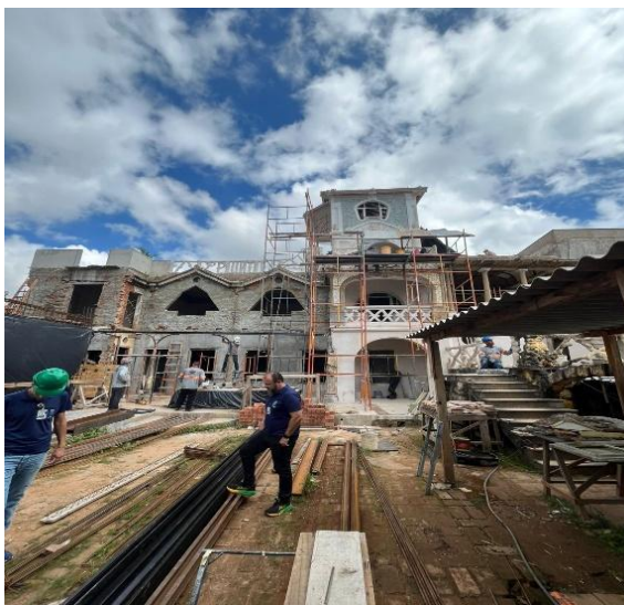
Palácio das Águias Autoria: Eduardo Santos Data: 26/03/2026

Os projetos têm como objetivo realizar a recuperação do edifício conhecido como Palácio das Águias para que seja utilizado como centro de cultura da cidade; ambos seguem a execução concomitantemente.