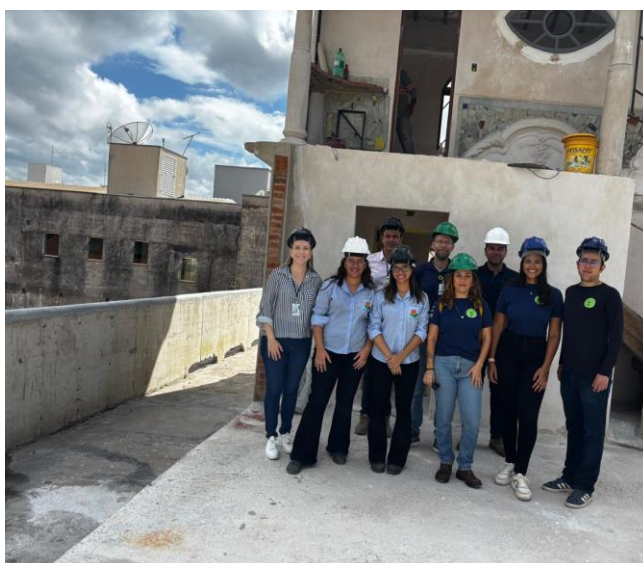
Palácio das Águias Autoria: Eduardo Santos Data: 26/03/2026